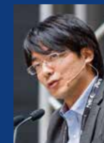
広瀬 一朗 (内閣官房情報通信技術 IT総合戦略室)