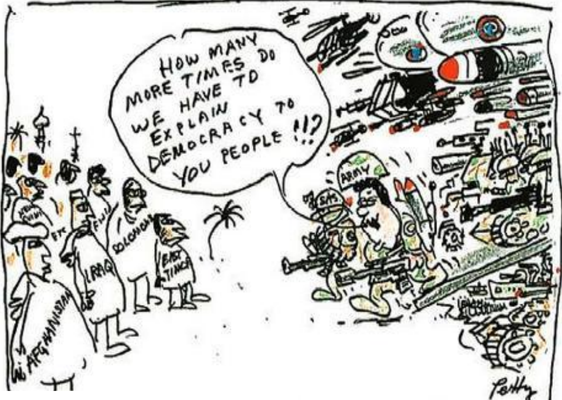
© The Eighth day, June 11, 2006.